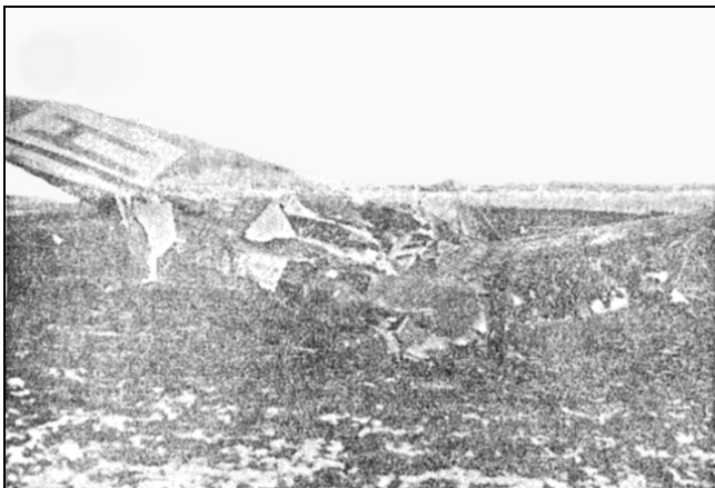
Halen af den flyvende Fæstning efter Eksplosionen.

Delingen skulde bombe Poznan i Polen. Den blev angrebet af tyske Jagere, der mødte Amerikanerne over Syd-Jylland, Lillebælt og Wedellsborg i stor Højde. Egnens Folk havde hørt Skyderiet en god Times Tid, da de Kl. 13.15 saa Dele af en Maskine komme ned gennem de lave Skyer. Paa et Omraade af flere Kilometer dryssede alle mulige Stumper ned. Først det kæmpestore Haleparti, saa større og mindre Dele af 9 Mennesker, Masser af Maskindele og endelig Planets brændende Krop med et voldsomt Brag.